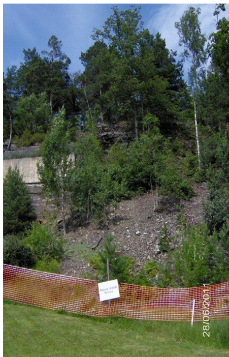
Rasområdet på Torp Høymyr, før utbedringen